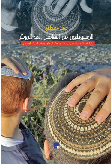
مهند مصطفى المستوطنون من الهامش إلى المركز زراعة المستوطنات للمركز من غوش ايمونيم إلى البيت اليهودي

اسم الكتاب: المستوطنون من الهامش إلى المركز من «غوش ايمونيم» إلى «البيت اليهودي» اسم المؤلف د. مهند مصطفى اسم الناشر: المركز الفلسطيني للدراسات الاسرائيلية «مدار» - رام الله. عدد الصفحات: ٨٨